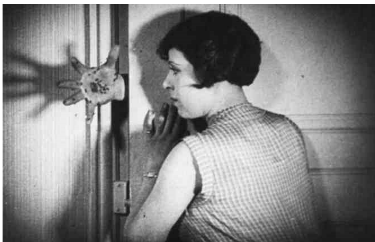
Un chien andalou , Luis Buñuel, Salvador Dalí, 1929

Explica'n tres aspectes: les característiques del surrealisme com a moviment artístic; les característiques de la pel·lícula com a exemple de manifestació cinematogràfica del surrealisme; i la col·laboració entre Dalí i Buñuel.