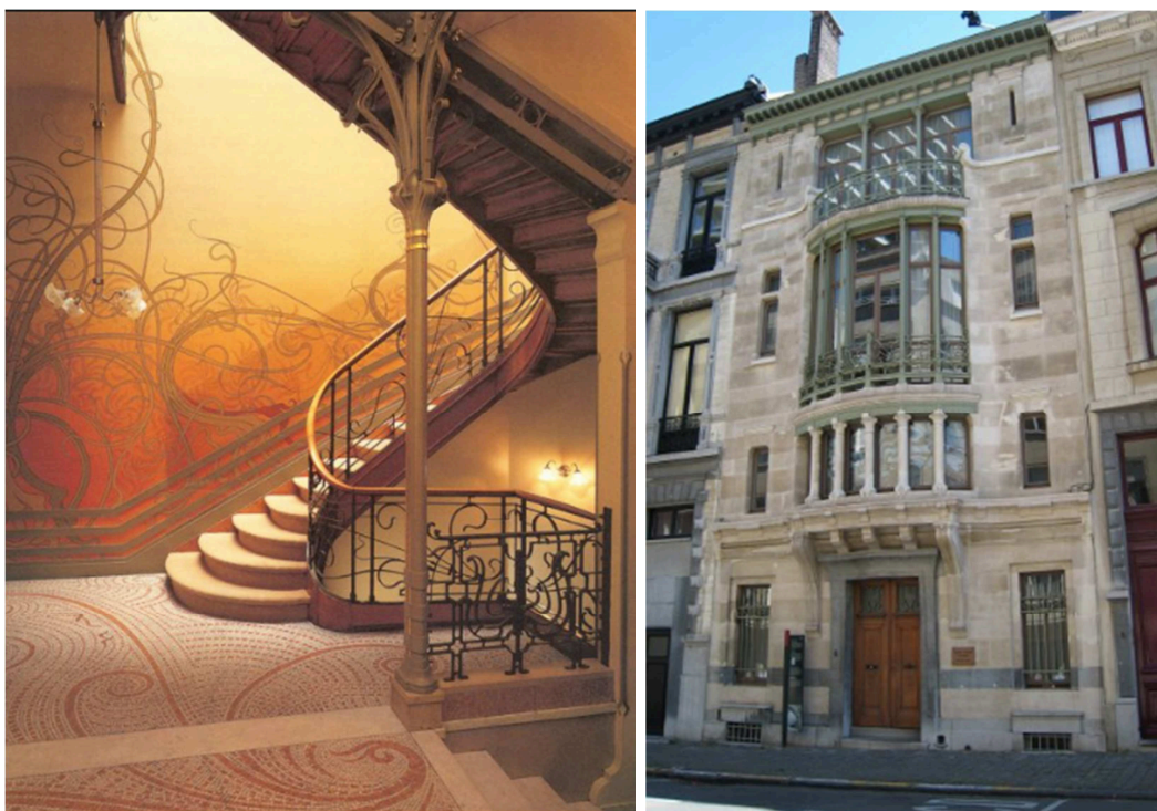
Casa Tassel , de Victor Horta, 1893

OPCIÓ B. Compara les dues obres proposades: la casa Tassel (1893) de Victor Horta i el Pavelló de Barcelona (1929) de Mies van der Rohe.