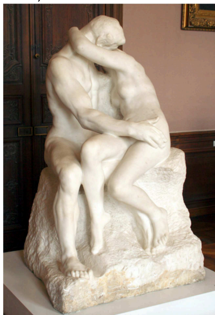
A. Rodin, La besada , c. 1882