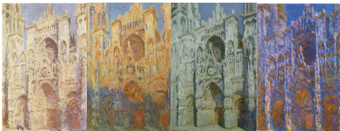
Claude Monet, Catedral de Rouen (selecció de quatre pintures de la sèrie), c. 1895