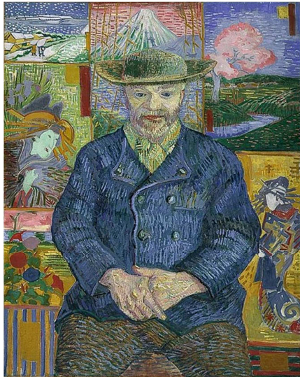
V. Van Gogh, Retrat del «père Tanguy» , 1888

OPCIÓ B. A partir d'aquestes dues obres, explica la influència de l'art del Japó en la pintura de final del segle XIX.