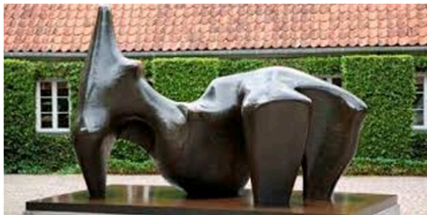
Henry Moore, Reclining Figure , 1969-70