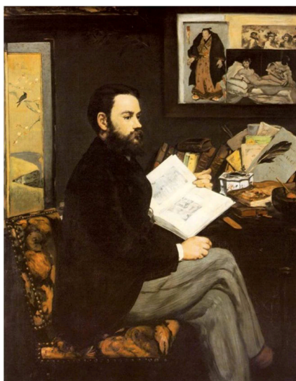
É. Manet, Retrat d'Émile Zola , 1868