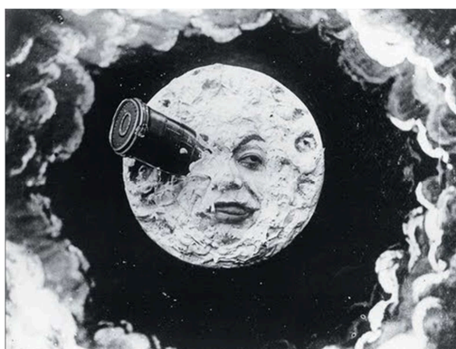
Georges Méliès, Viatge a la Lluna , 1902