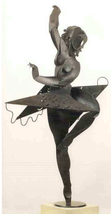
Pablo Gargallo, Gran ballarina , 1929

OPCIÓ A. L'escultura contemporània. Compara aquestes dues obres: Reclining Figure (1969-70) de Henry Moore i Gran ballarina (1929) de Pablo Gargallo.