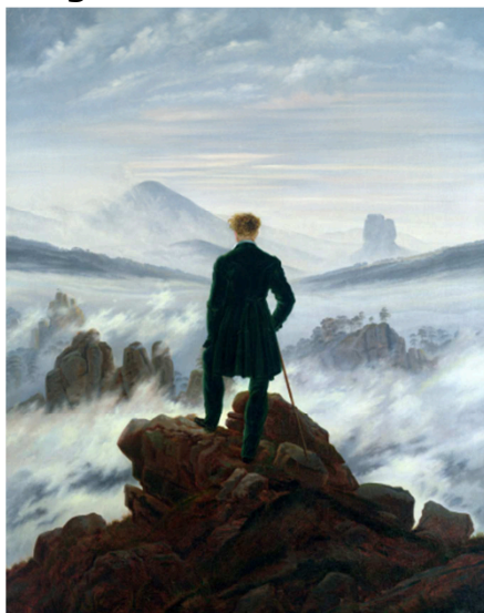
Caspar D. Friedrich, Caminant damunt un mar de boira , 1817